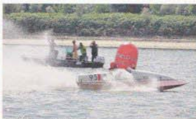
Passione Alcuni momenti della due giorni della «Sacca Racer Meeting. Trofeo Caggiati Matthews».