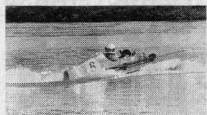
58° RAID LA SORPRESA