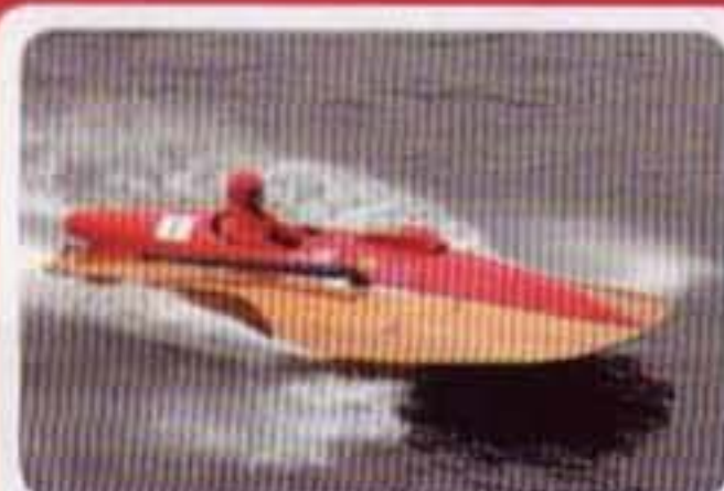
Lacarelle François F Barca Lambro #1 1963 Lancia 6 cil. 2458 cc Record mondiale 1968