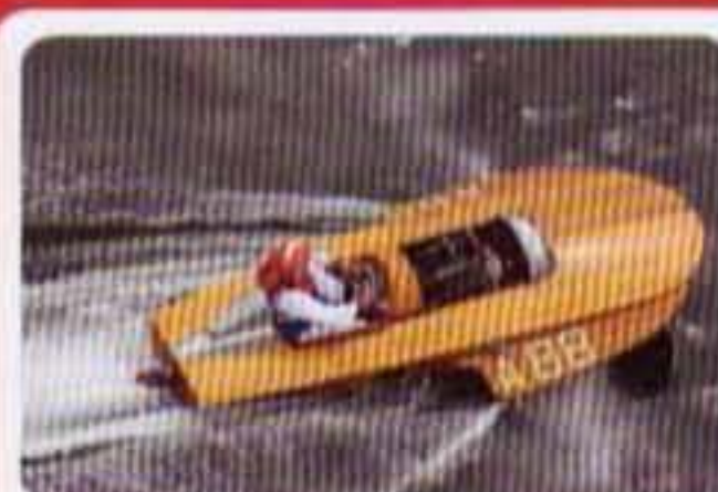
Van Praet Jean B Barca Ventnor #A88 1946 Hofenhauser 8 cil. 6300 cc Portata in Belgio da un colonnello esercito USA subito dopo la guerra