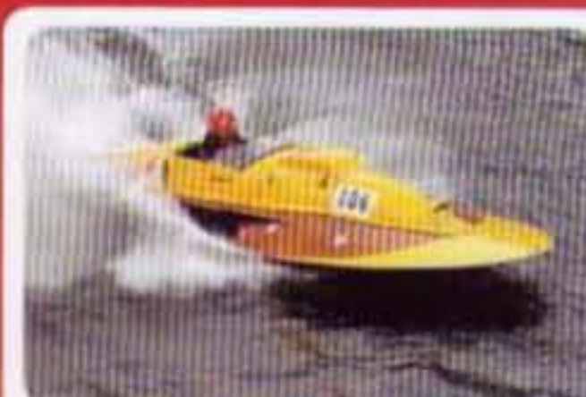
Cima Giovanni I Barca Timossi #106 1968 BPM Vulcano 8 cil. 8000 cc Campionato del mondo 1968, pilota vincitore Pavia-Venezia 1982