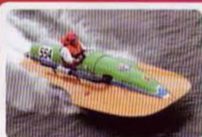
Ferrari Giovanni I Barca Popoli #554 1966 Alfa Romeo 4 cil. 2000 cc Partecipazione diverse gare