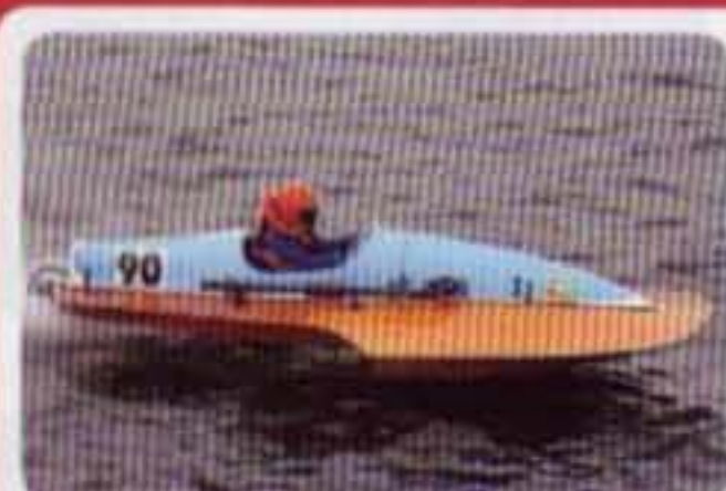
Spacio Athos CH Barca Lucini #90 1973 Alfa Romeo 4 cil. 2000 cc Partecipazione diverse gare