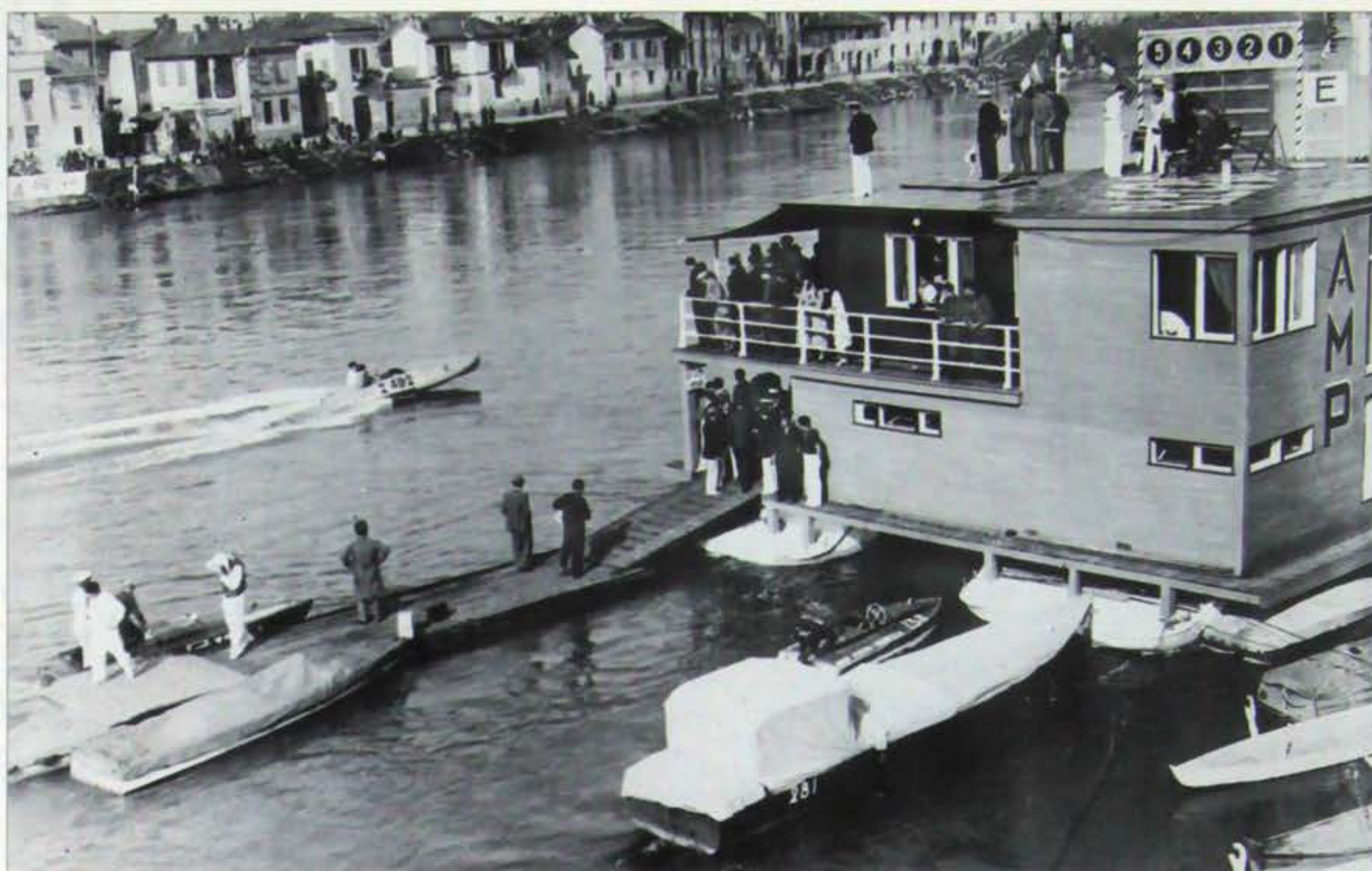
Prima sede Motonautica Pavese.