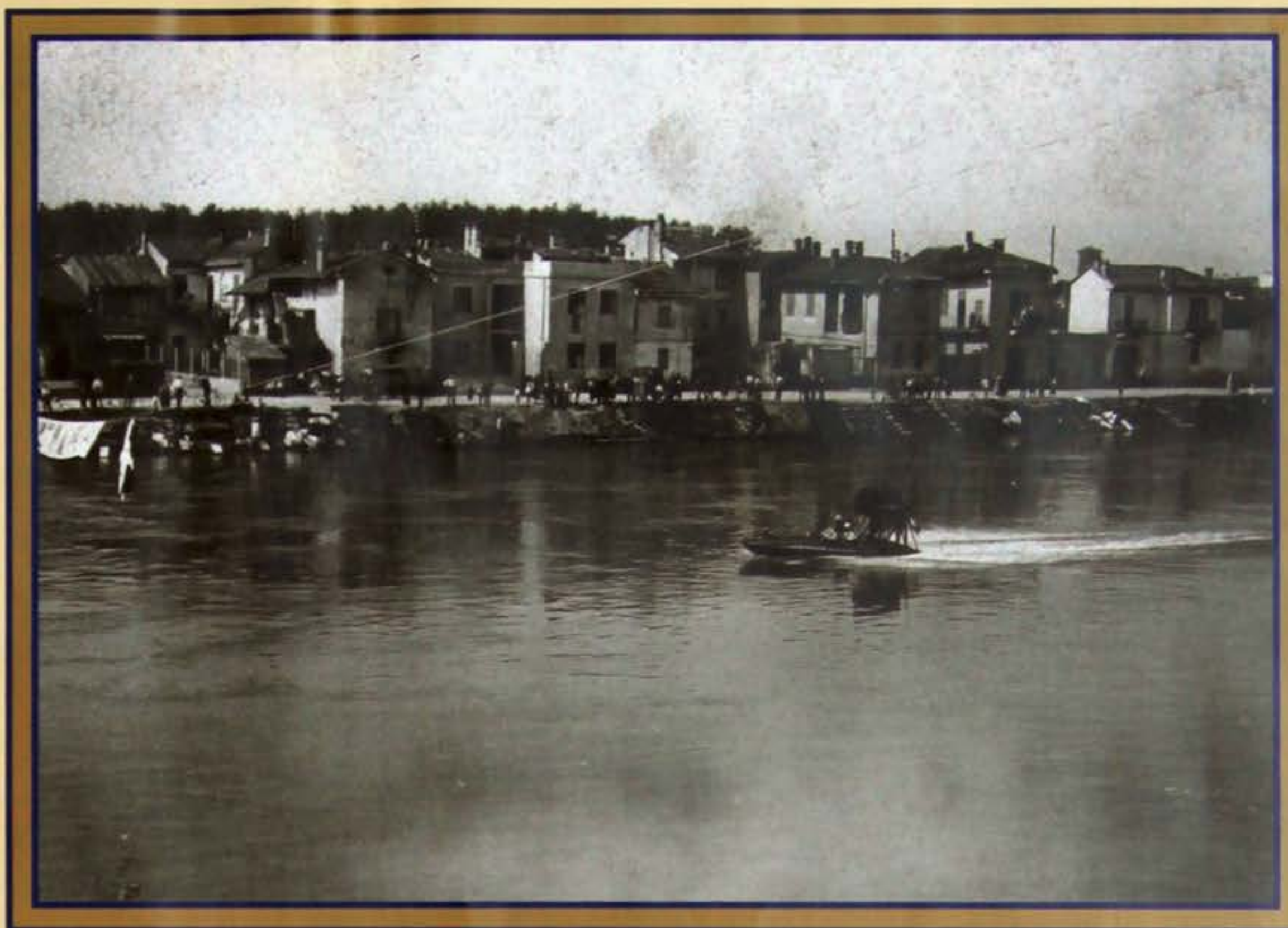
Idroscivolante e le rive del Borgo Ticino

Al ponte di S. Benedetto Po, ove non erano controlli ma ove si erano raccolti numerosissimi spettatori avemmo il piacere di trovarci mentre vi giungeva in piena maestosa velocità il Pitta del Conte Mazzotti col Principe Ruspoli, passeggero e con Rampini, motorista. Fummo favoriti anche dalle condizioni di luce che ci permisero di ottenere una riuscita fotografia.