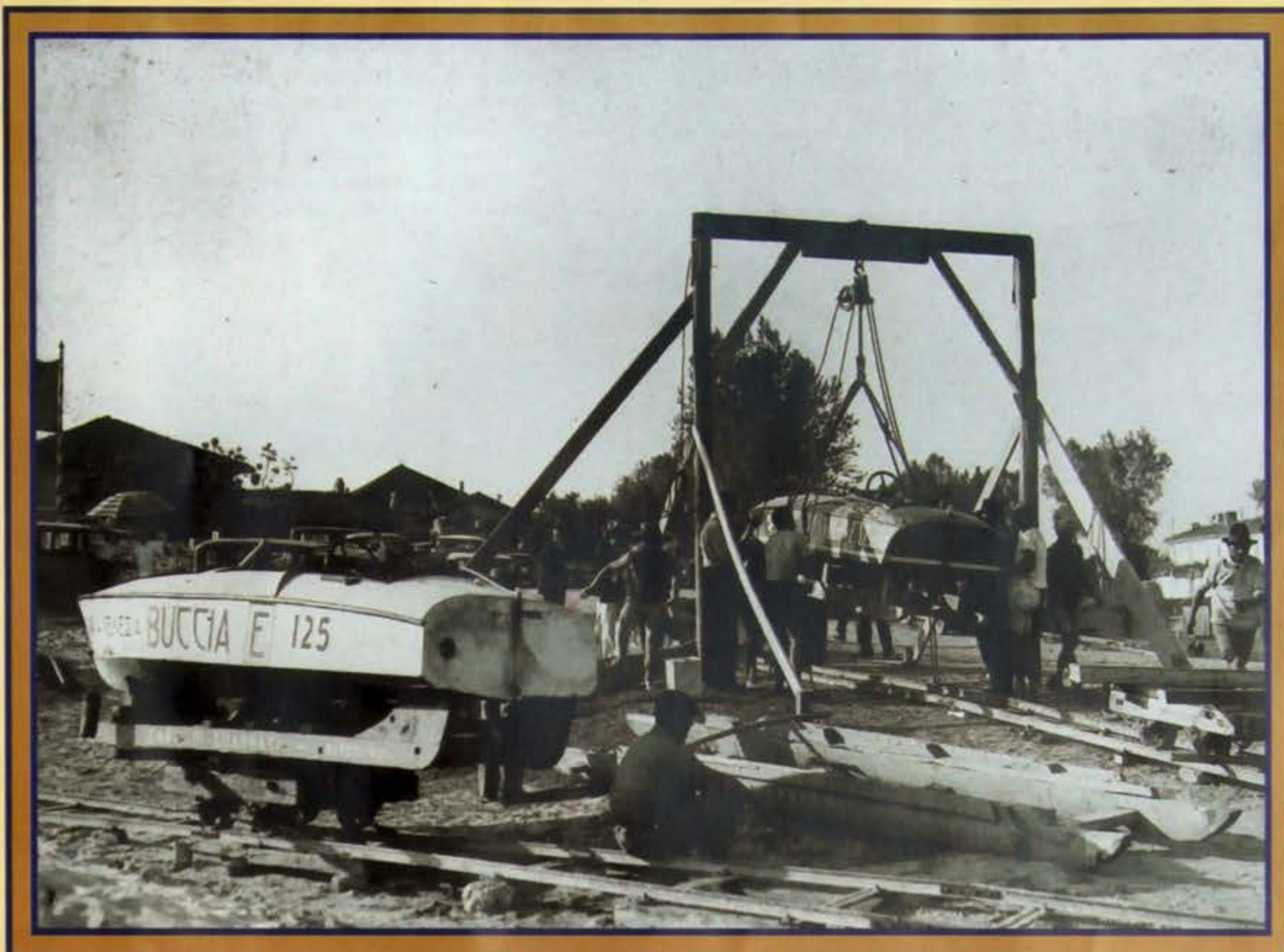
Alaggio scafi nei pressi del confluente (Pavia).