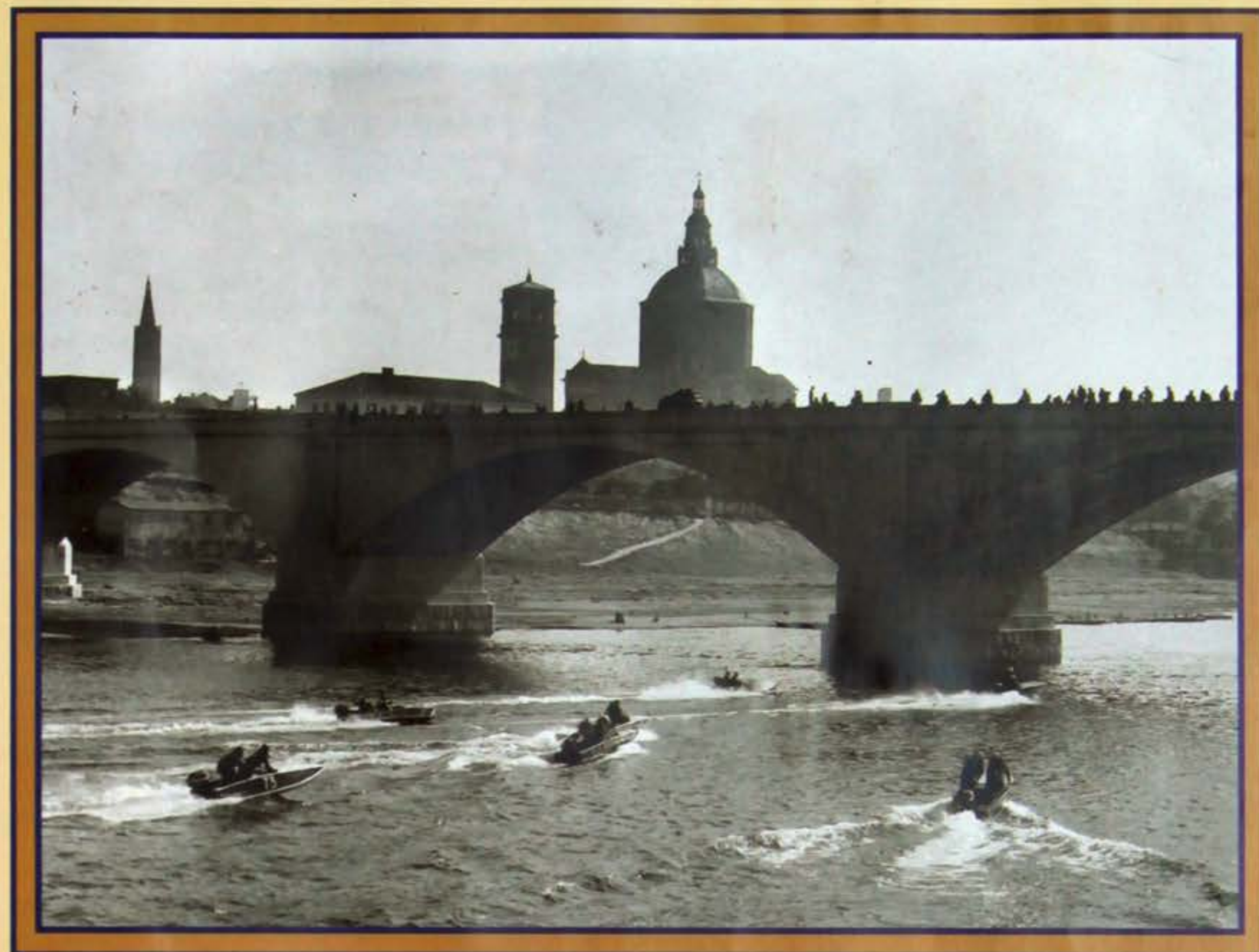
Veduta di Pavia e partenza Raid anni '50.