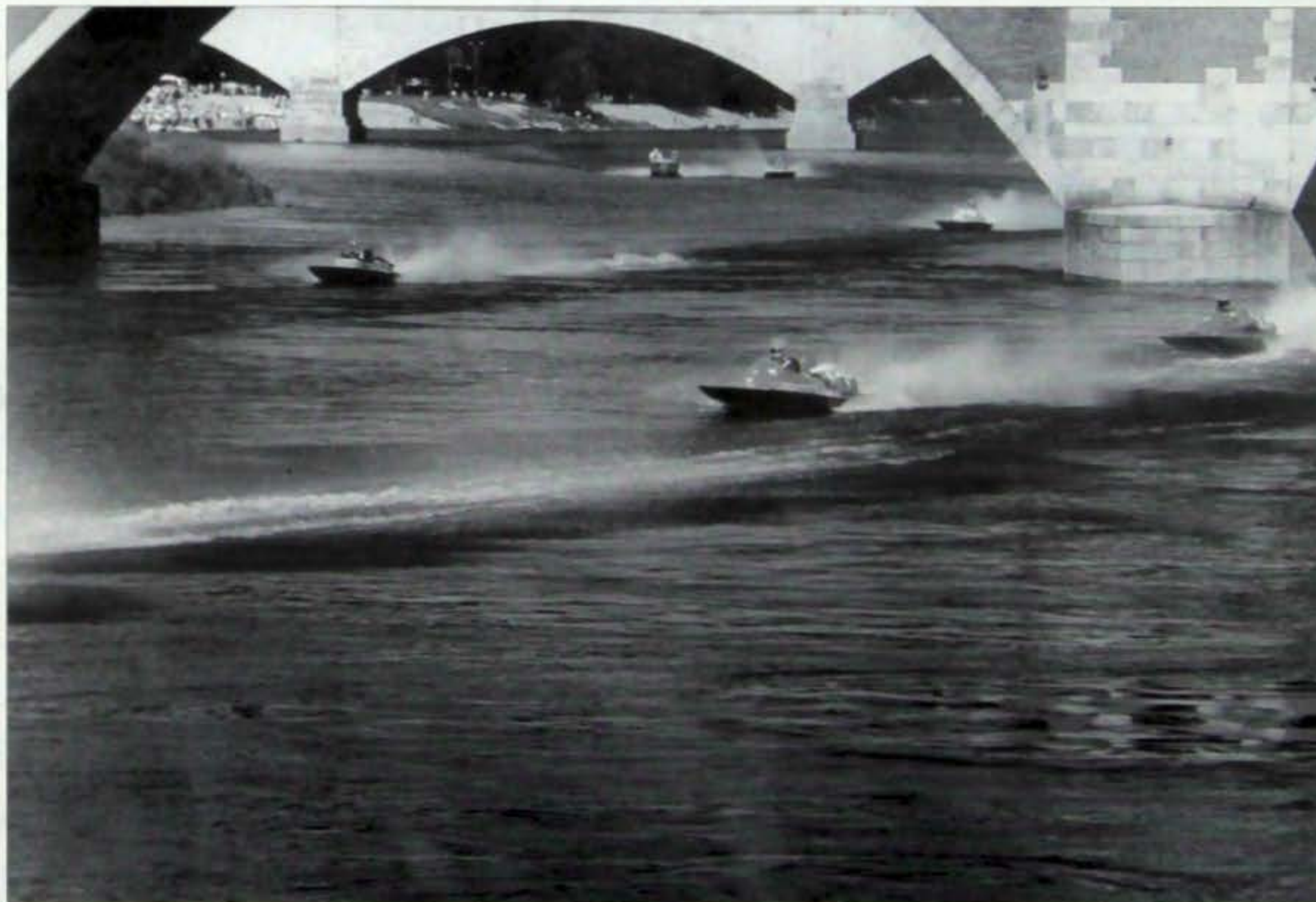
Raid del 1985. I Coven alla partenza.