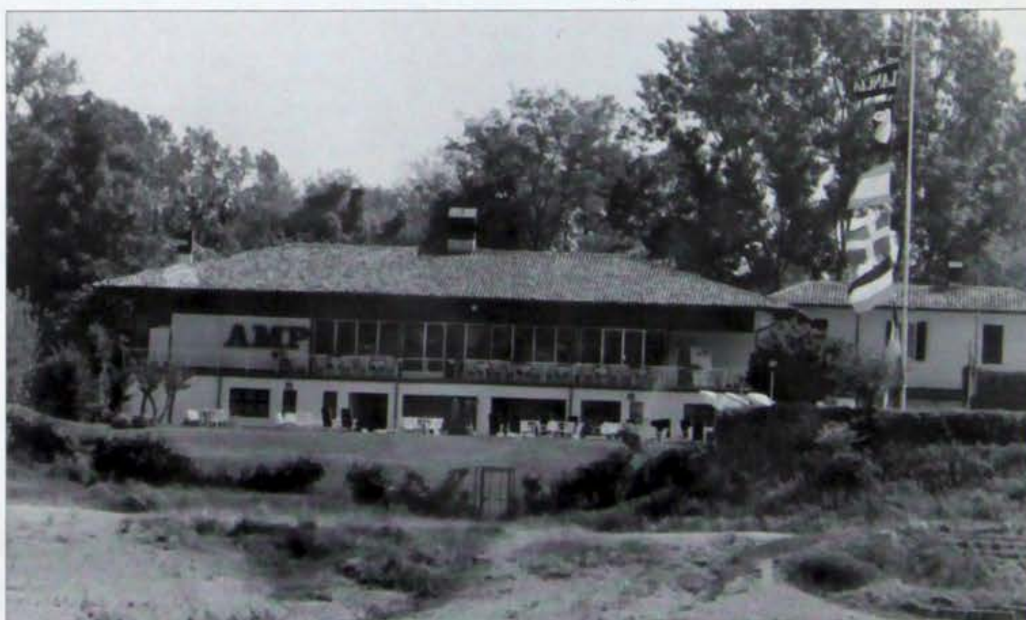
L'attuale SEDE A.M.P.

Questo documento, è la ricevuta originale del versamento del contributo per la costruzione della prima SEDE della Motonautica.