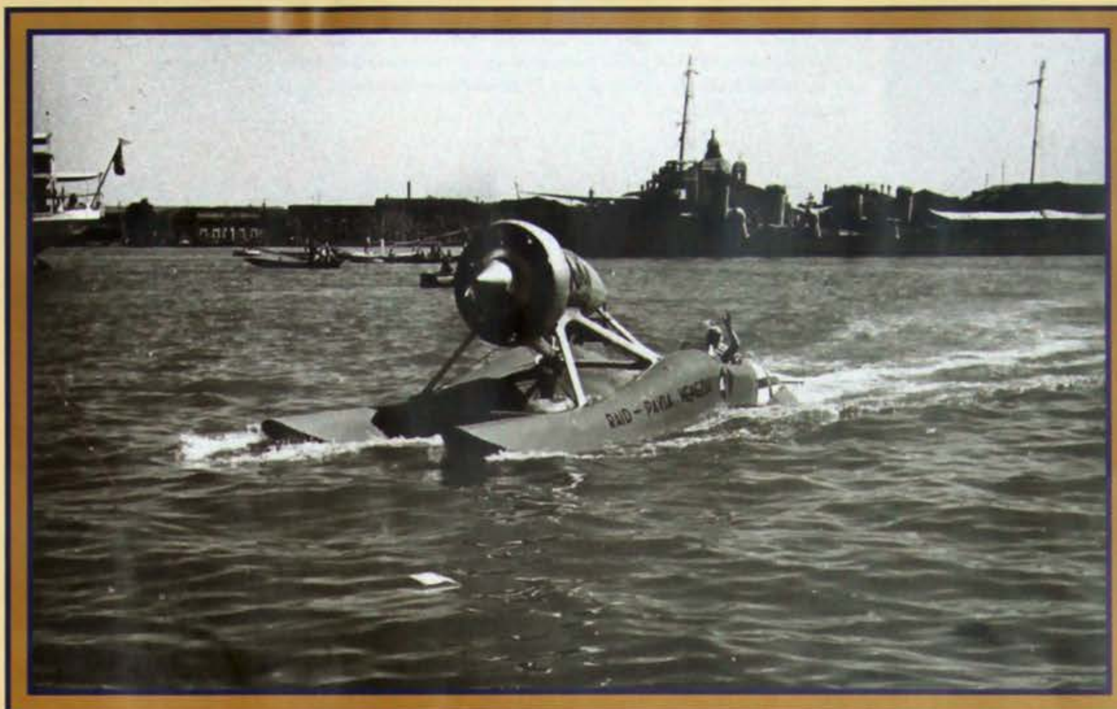
Idroscivolante all'arrivo a Venezia.

Le carte segnano delle strade che lungo gli argini costeggiano quasi sempre il fiume ma queste strade spesso sono poco praticabili, con profonde carreggiate e si è obbligati ad andare molto adagio, sia per tema di toccar terra col grembiale sotto al motore, sia per tema di andar a finire in acqua. Poi ogni tanto la strada è sbarrata ed allora bisogna scendere dall'argine ed andarsene in cerca della propria via nel dedalo delle strade e stradette della feracissima pianura padana, strade e stradette che non si possono individuare prontamente su qualsiasi carta e che correndo in tutte le direzioni a causa dei meandri del fiume vicino fanno perdere l'orientamento. E allora non resta che domandare agli indigeni, gentilissimi e premurosi ... ma che spesso finiscono col farvi imbrogliare ancora maggiormente.