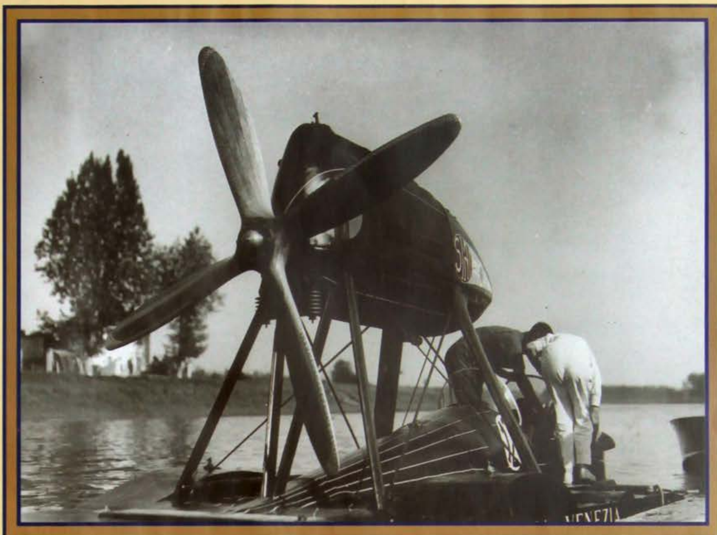
Ultimi preparativi in attesa della partenza nei pressi del confluente (Pavia).